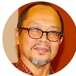
Kepala BAPETEN Jazi Eko Istiyanto

Kalimantan Timur memang sedang giat dalam impiannya mewujudkan pendirian PLTN di provinsi terbesar di Pulau Kalimantan ini. Selain aspek sosial dan ekonomi yang akan sangat berpengaruh bagi masyarakat